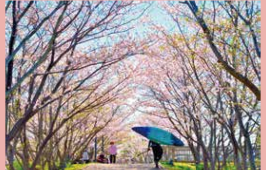
手賀沼写真コンクール入選作品展示