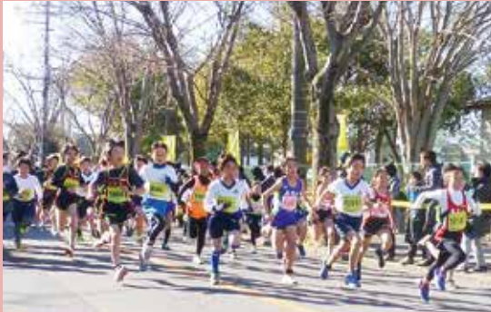
我孫子市新春マラソン大会