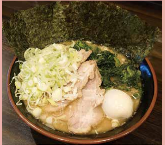
横浜らーめん 寿三家