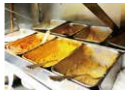
カレーに欠かせないスパイス

そして、インドカレーといえばやっぱりナン。タンドールでふっくら焼き上げた香ばしい香りが食欲をそそります。少しずつちぎり、たっぷりカレーをつけて食べればそこはもうインドです。*ライスにも変更できます。この機会に、我孫子市産季節の野菜カレーをぜひお召し上がりください。