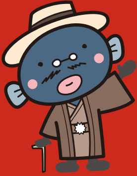
我孫子市マスコットキャラクター 手賀沼のうなぎちゃん