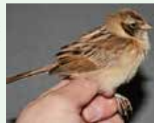
足環を標識されたコジュリン

バンディング(標識調査)は、個体を識別するための標識を鳥に付けて、渡りや寿命を調べる調査です。日本では、環境省が山階鳥類研究所に委託して調査が行われており、各地で様々な鳥を対象とした調査が実施されています。バンディングではどのように調査が行われているかや、バンディングによって明らかになった鳥たちの渡りや生活をご紹介します。