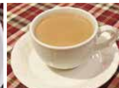
冬はホットチャイがオススメ