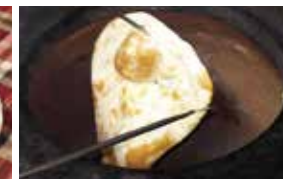
注文を受けてから焼き上げる熱タナン