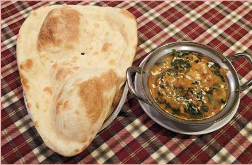
インド・ネパール レストラン & バー ハリオン