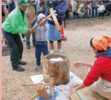
新年ちびっこ餅つき大会